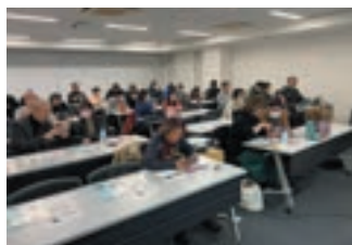
スキルアップ勉強会の様子

Canvaは動画やAIなど様々な利用方法があります。動画の利用法をもっと知りたいというリクエストがありましたので、次回(6月頃開催予定)は動画編集について勉強会を開催したいと思っています。