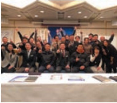
大分東倫理法人会の仲間たちと

「心が軽くなる」「自己肯定感が高まる」「対人関係が円滑になる」「ストレスケアが可能になる」「トラウマが癒える」などの効果が期待できます。一般の方から企業・団体まで幅広い方々にご利用いただいています。