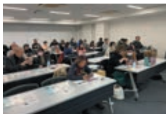
スキルアップ勉強会の様子

Canvaは動画やAIなど様々な利用方法があります。動画の利用法をもっと知りたいというリクエストがありましたので、次回(6月頃開催予定)は動画編集について勉強会を開催したいと思っています。