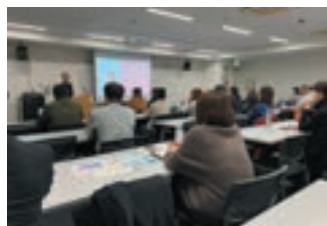
皆さんCanvaを使いこなすべく真剣!