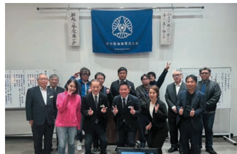
大分臨海倫理法人会の皆さんの集合写真