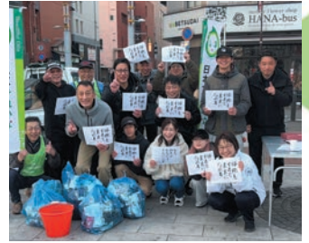
毎週日曜の朝のイツメンたち