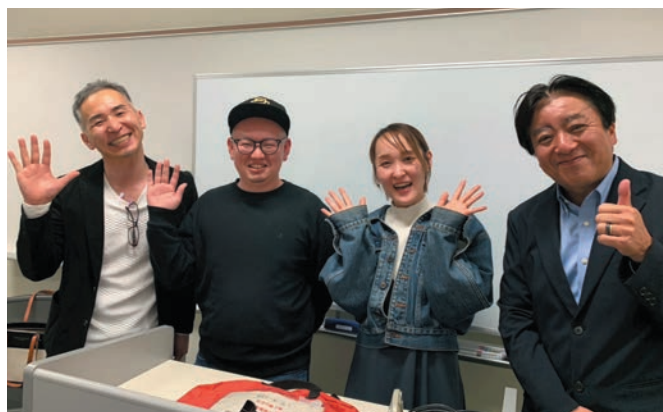
広報委員長と講師の皆さま